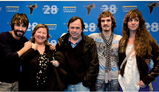
Actores y directores de 'El Extraño Anfitrión'.